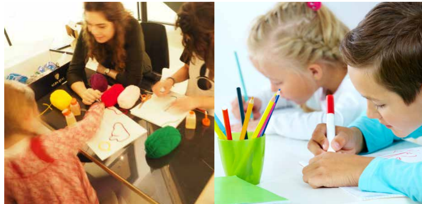
Atelier Drawing Kids du Drawing Lab