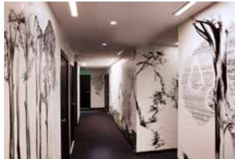
Drawing Hotel, 2ème étage - Abdelkader Benchamma