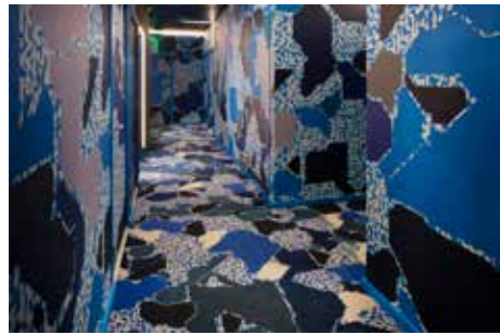
Drawing Hotel, 1er étage - Lek & Sowat