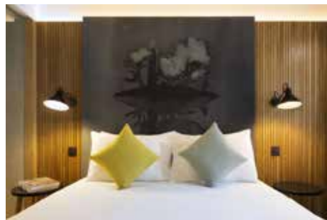
Drawing Hotel, 4ème étage - Françoise Pétrovitch

Le Drawing Hotel a ouvert ses portes en février 2017. Ce boutique hôtel d'exception de 48 chambres est un vrai concentré d'originalité.