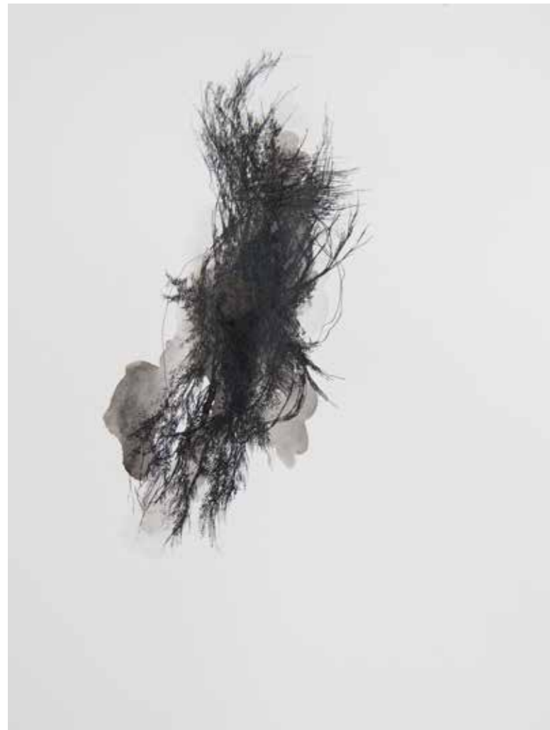
Gaëlle Chotard, Sans titre , 2017, encre de chine sur papier, 23 x 31 cm

« Sauras-tu jamais ce qui me traverse Ce qui me bouleverse et qui m'envahit Sauras-tu jamais ce qui me transperce Ce que j'ai trahi quand j'ai tressailli »*